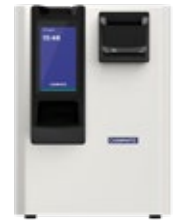
cashmatic selfpay 1060

altura 57,9 cm largura 34,0 cm profundidade 36,8 cm