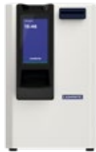
cashmatic selfpay 660

altura 48,4 cm largura 33,4 cm profundidade 42,1 cm