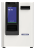
cashmatic selfpay 460

O mais compacto, com um equipamento extra; Velocidade de pagamento: até 4 pagamentos/min; Capacidade de gerenciamento de fluxo: até 15 mil euros; Capacidade de quantidade de flutuação auto-recarregável: 70 notas de 1500 euros em moedas.