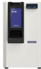
cashmatic selfpay 860

altura 54,3 cm largura 34,0 cm profundidade 36,8 cm